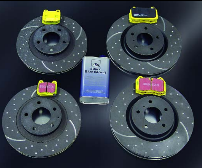
Hochleistungs-Bremsscheibensatz mit Belägen für Vorder- und Hinterachse (Komplettes-Kit)