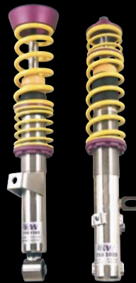
KW Gewindefahrwerk Stufe 3 mit Nordschleifen-Abstimmung