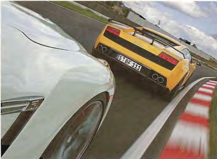
Aufgebauscht: Den ab Werk installierten Stummelflügel tauscht BF Performance gegen eine starre Karbonlösung aus - mit höherem Showeffekt