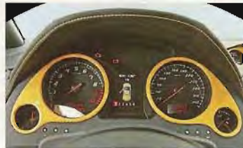
Zügellos und ungehemmt: Der Lambo-Motor steht auf Drehzahlorgien