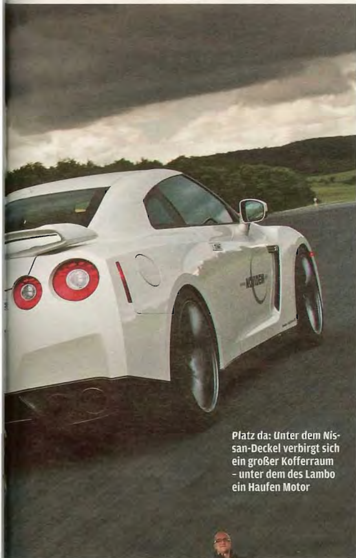
Platz da: Unter dem Nissan-Deckel verbirgt sich ein großer Kofferraum – unter dem des Lambo ein Haufen Motor