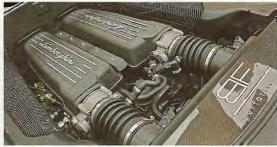
Ein Bild von einem Motor: Der Anblick dieses formidablen Filetstücks verspricht nicht zu viel. Einmal am V10 geknabbert ist der Weg in die Sucht vorgezeichnet