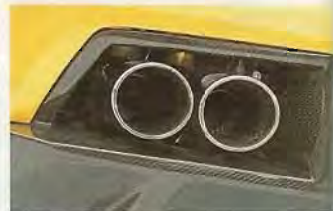
Don't call it Lärm: Dem Serienauspuff entweichen berauschende Arien