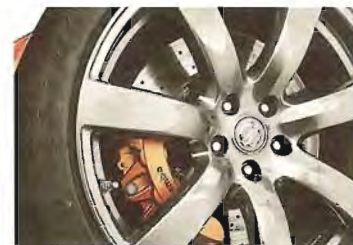
Stabilitätsfaktor: Die standfeste Bremsanlage gibt sich keine Blöße