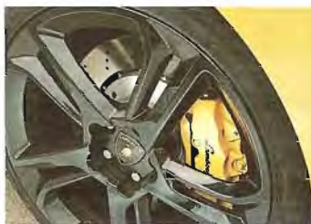
Karriereknick: Die Serienstopper können nicht rundum überzeugen