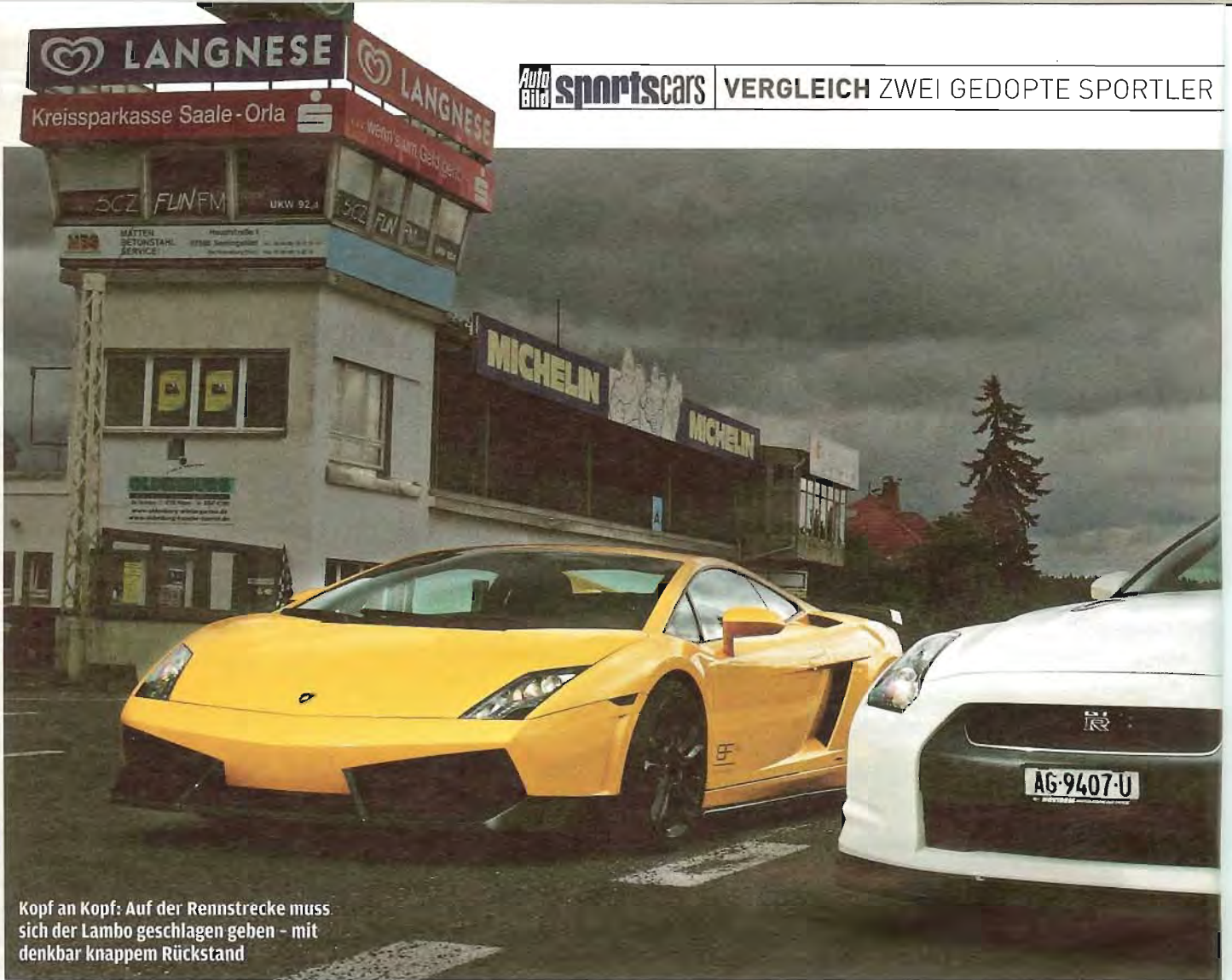
Kopf an Kopf: Auf der Rennstrecke muss sich der Lambo geschlagen geben - mit denkbar knappem Rückstand