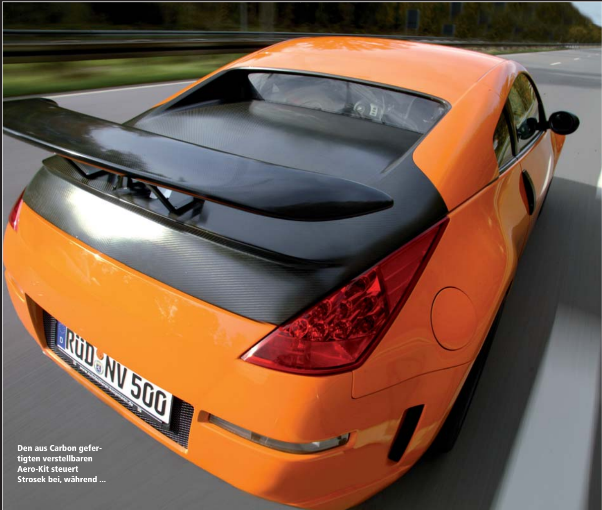
Den aus Carbon gefertigten verstellbaren Aero-Kit steuert Strosek bei, während ...