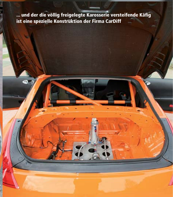
... und der die völlig freigelegte Karosserie versteifende Käfig ist eine spezielle Konstruktion der Firma CarDiff