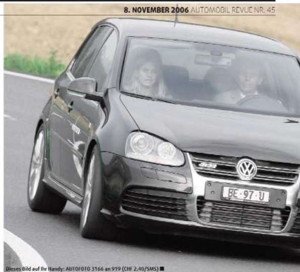
8. NOVEMBER 2006 AUTOMOBIL REVUE NR. 45

Dank der serienmässigen Launch Control des R32 spart die Novidem-Flitzer in 5,4 s aus dem Stand auf 100 km/h. Dies entspricht einer «Zeitersparnis» von 0,3 s. Frappanter ist der Unterschied, wenn man bis 200 km/h weiterbeschleunigt. Bei dieser Übung schlägt der zuzugestimmte R32 den serienmässigen Wagen (Test in AR 5/06) um satte 7,5 s, beim Kilometer mit stehendem Start geht der Vergleich mit 24,9 zu 26,6 s natürlich ebenfalls zugunsten des aufgemotzten Golf aus. Dank des Allradantriebs kennt der R32 keinerlei Traktionsprobleme und kann die gebotene Leistung entsprechend verlustfrei in Vortrieb umsetzen.