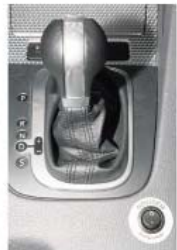
Wie einst bei Mad Max: Der Kompressor ist zuschaltbar.

Auch der Dreh am Zündschlüssel verrät vorerst nichts über die geballte Ladung Power, die unter der Haube schlummert.